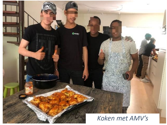
Koken met AMV's