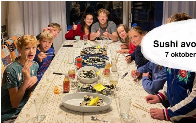
Sushi avond 7 oktober