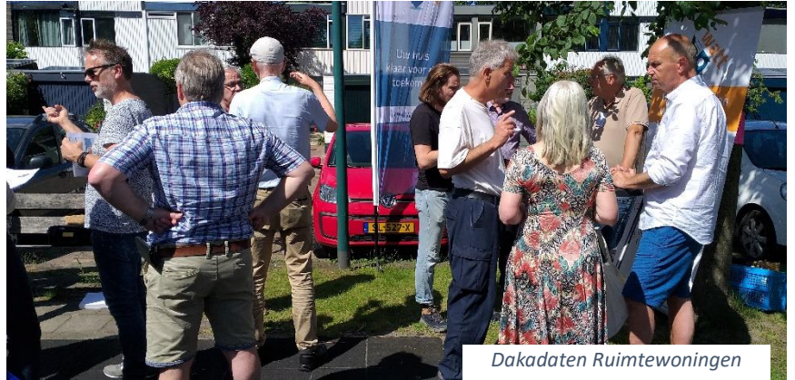
Dakdaten Ruimte woningen