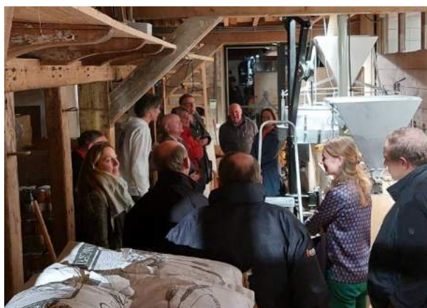
PG op bezoek bij De Veldkeuken in Bunnik

Beide PG's hebben in 2022 vier keer vergaderd, waarvan drie keer gezamenlijk: 9 maart (PG Heuvelrug & Kromme Rijn), 11 maart (PG Vallei), 11 mei (beide PG's), 15 september (beide PG's) en 9 november (beide PG's). De vergaderingen vonden iedere keer plaats bij een ander LEADER-project, zodat voorafgaand aan de vergaderingen ook het betreffende project bekeken kon worden en de initiatiefnemer hierover kon vertellen.