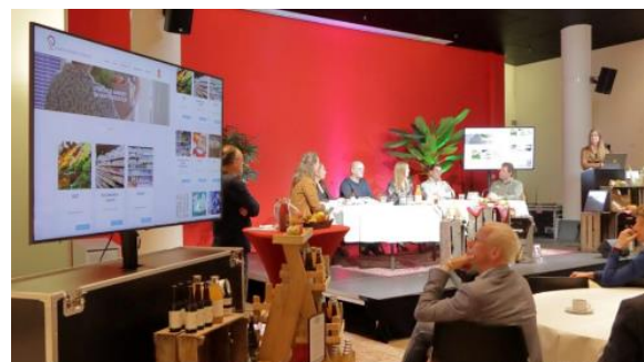
Slotbijeenkomst/ Talkshow op 14 maart 2022

Het samenwerkingsproject Lokaal Voedsel Utrecht, dat samen met LEADER Weidse Veenweiden wordt uitgevoerd, is in 2019 gestart en in 2022 afgerond. Doel van dit samenwerkingsproject was het uitwisselen van kennis en versterken van LEADER strategie rond het thema Lokaal Voedsel: het verbinden van vraag en aanbod. Het projectteam heeft in samenspraak met de projectgroep (waarin leden van beide LEADER-groep en zitting hebben)