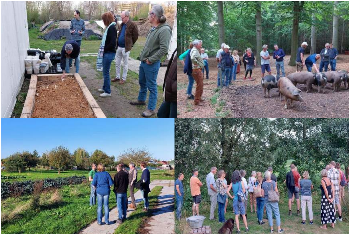
Impressie van de verschillende Expedities

Net als in 2021 hebben we ook in 2022 samen met LEADER Weidse Veenweiden diverse Expedities georganiseerd: excursies naar LEADER-projecten in afwisselend Oost en West Utrecht. In Utrecht Oost vonden de volgende zes Expedities plaats: 13 april naar het project van Koffiedik tot Knolselderij van de Fungi Factory in Utrecht, op 17 mei naar het project Buitengewone Varkens bij landgoed Zuylestein in Leersum, 7 juli naar de Dorpstuinderij in Den Dolder, 24 augustus naar het project Lekker Landschap in Langbroek, 5 september naar de projecten Zeldert Werkt en Windwheeler in Hoogland en 18 oktober naar Herenboerderij Nieuw Bureveld in De Bilt.