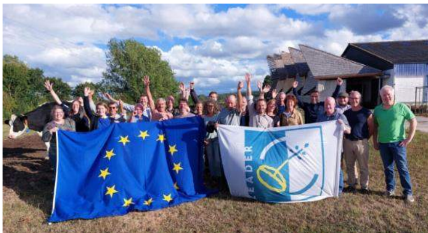
Bezoek aan LAG Pays des Condruses, Wallonie, 8 september 2022