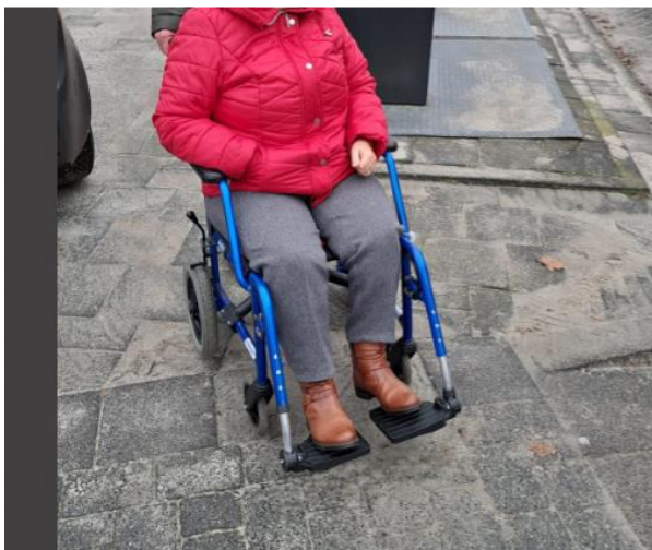
Foto 3: Doorgang wordt versperd door auto die op de stoep geparkeerd staat.