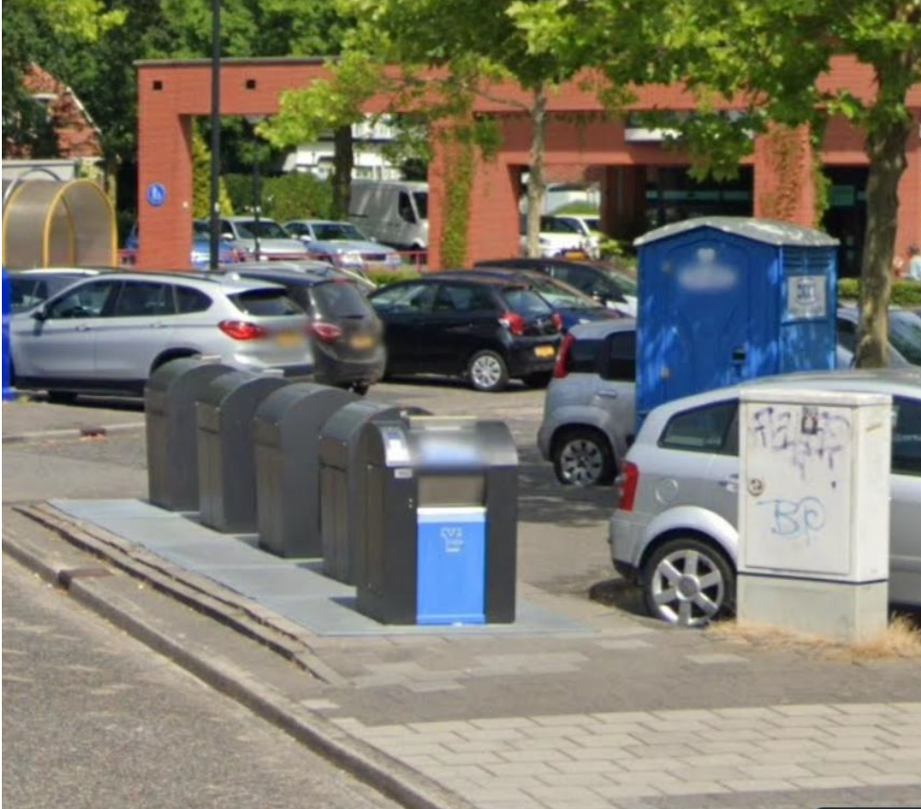
Foto 4: achterzijde van de papier-/glas/kunststofcontainer(s). De achterzijde van de containers is slecht toegankelijk voor rolstoelgebruikers en minder valide personen in verband met hoogteverschillen en de smalle breedte achter de containers (straatzijde).