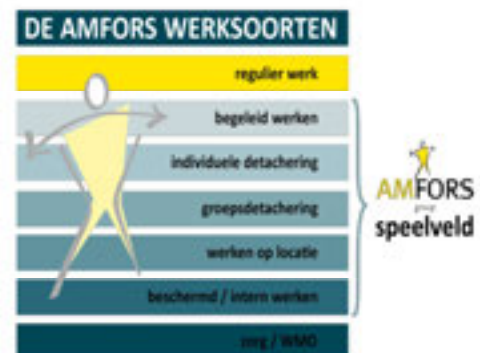
Figuur 1: Werksoorten

Arbeidsinventarisatie en -ontwikkeling – De focus van Amfors ligt voornamelijk op het realiseren en behouden van een duurzame arbeidsplek voor de Sw-medewerkers. Amfors voert hiervoor ontwikkelgesprekken met de medewerkers. Deze ontwikkelgesprekken geven inzicht in de individuele mogelijkheden en beperkingen met als doel de medewerkers een zo passend mogelijke duurzame werkplek te bieden. Amfors biedt daarbij diverse opleidingen en trainingen zoals: Werk je fit, Fluitend naar je werk, Omgaan met Geld. Ook op het gebied van taalvaardigheid geeft Amfors met regelmaat cursussen Nederlandse taal. Daarnaast volgen diverse medewerkers de verplichte opleidingen in het kader van veiligheid.