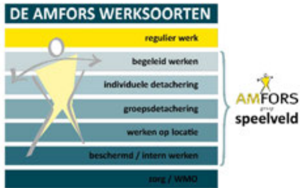
figuur 1: Werksoorten

Mobiliteit – Doelstelling is om iedere Sw-medewerker zo duurzaam mogelijk te laten werken op een passende werkplek waar men 'werkt naar vermogen'. Dat wil zeggen dat we uitgaan van mogelijkheden. De afgelopen jaren is deze ontwikkeling weergegeven als treden op de werkladder. Als gevolg van vergrijzing en toename van de beperking is steeds minder sprake van doorstroom op die werkladder en spreken we daarom over een verdeling in werksoorten.