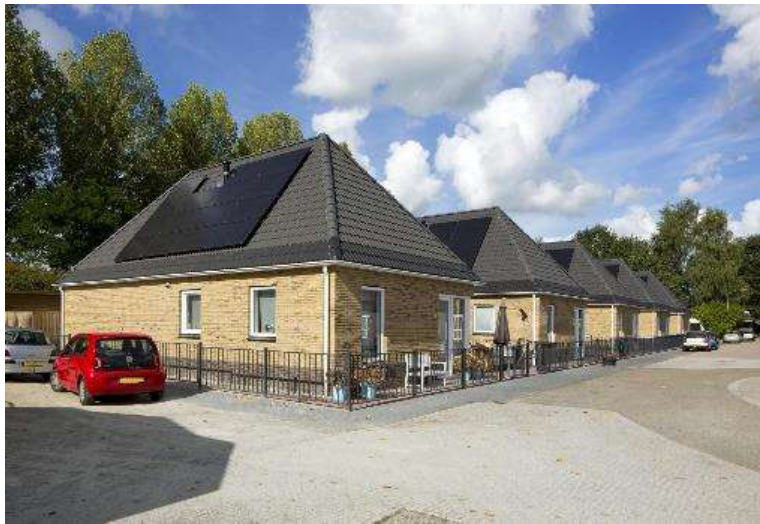
Versteende woonwagen / woonwagenwoning