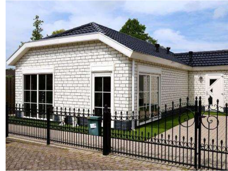
Woonwagen / Chalet