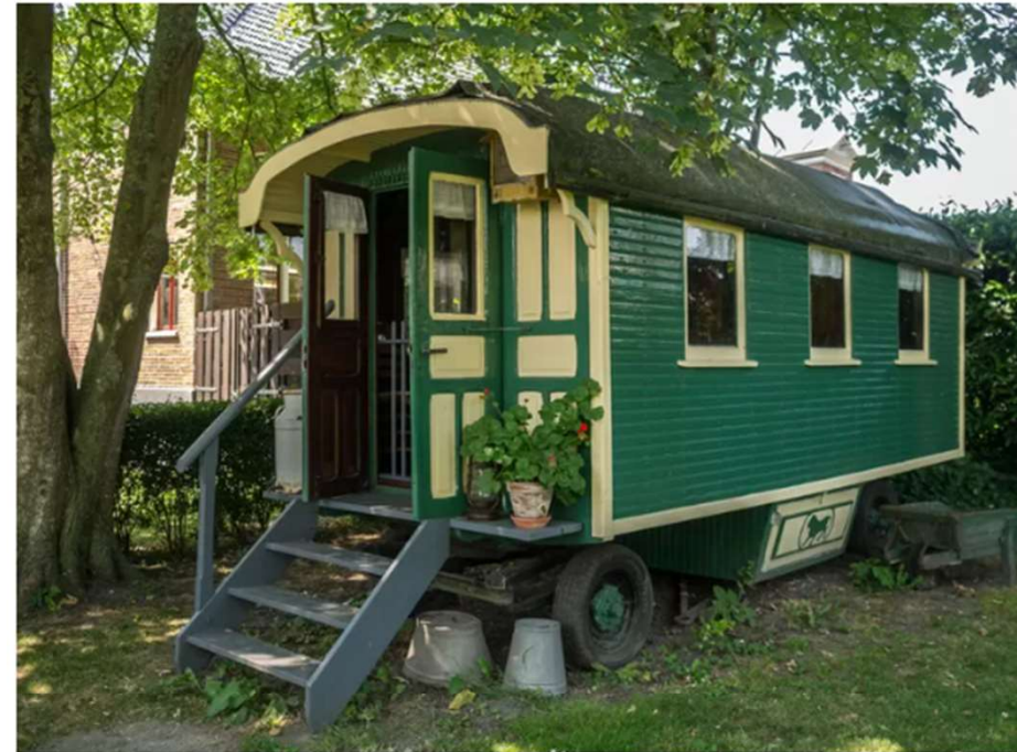
▲ Voorbeeld van een woonwagen