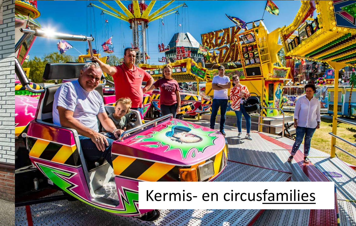
Kermis- en circus families