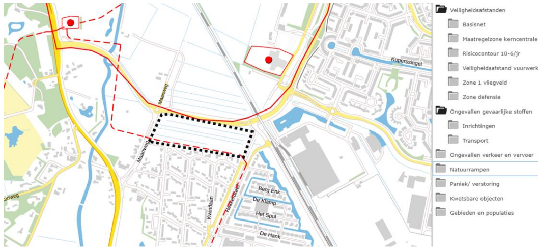
Uitsnede risicokaart met plangebied blauw omcirkeld

Via de website risicokaart.nl kan voor de locatie worden vastgesteld of er in de directe omgeving inrichtingen, buisleidingen en / of belangrijke transportroutes aanwezig zijn die in het kader van de externe veiligheid van belang zijn. Bijgevoegd een screenshot van die website.