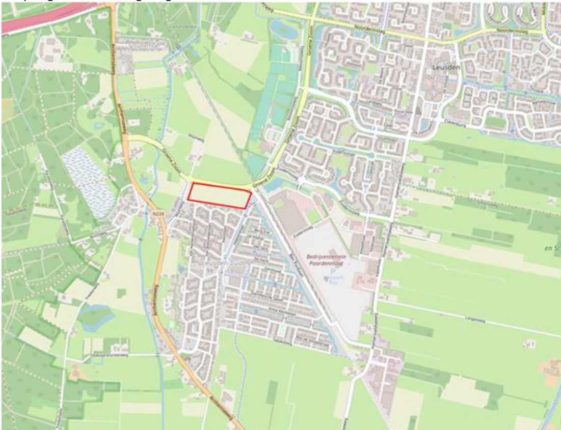
De ligging van het plangebied (rode kader) in de omgeving

Het plangebied ligt aan de noordkant van in Leusden-Zuid. Bijgevoegde afbeelding toont globaal de ligging van het plangebied in de omgeving.