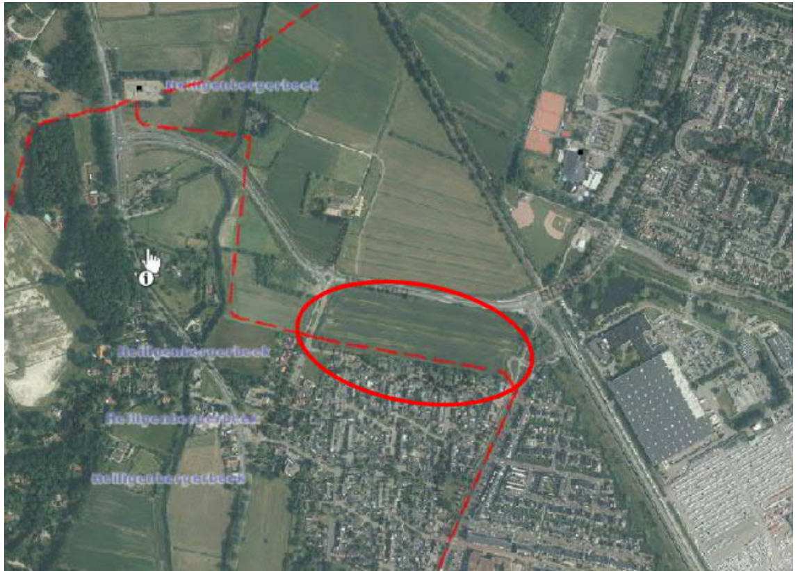
Figuur 3.1 Ligging buisleiding ten opzichte van het plangebied

Op grond van de informatie van de risicokaart zijn onderstaand de relevante gegevens van deze buisleiding samengevat.