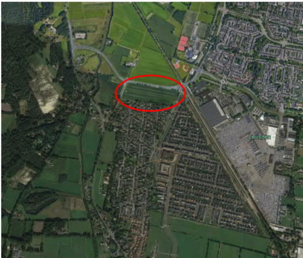
Figuur 1.1: Ligging van het plangebied

De ligging van het plangebied is weergegeven in figuur 1.1.