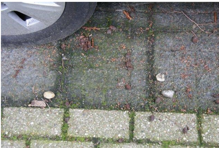
Stenen die de vogels op auto's gooien