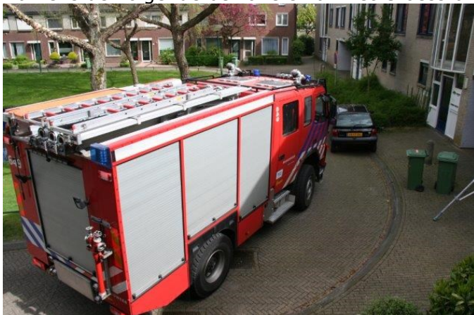
Parkeeroverlast op het Croessrak

Namens de volgende bewoners van het Croessrak.