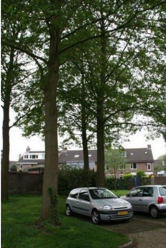
Hoge bomen nabij de parkeerplaats van het Croessrak zorgen voor overlast