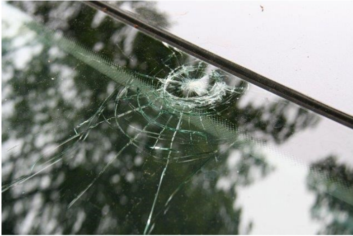
Berokkende autoruit schade