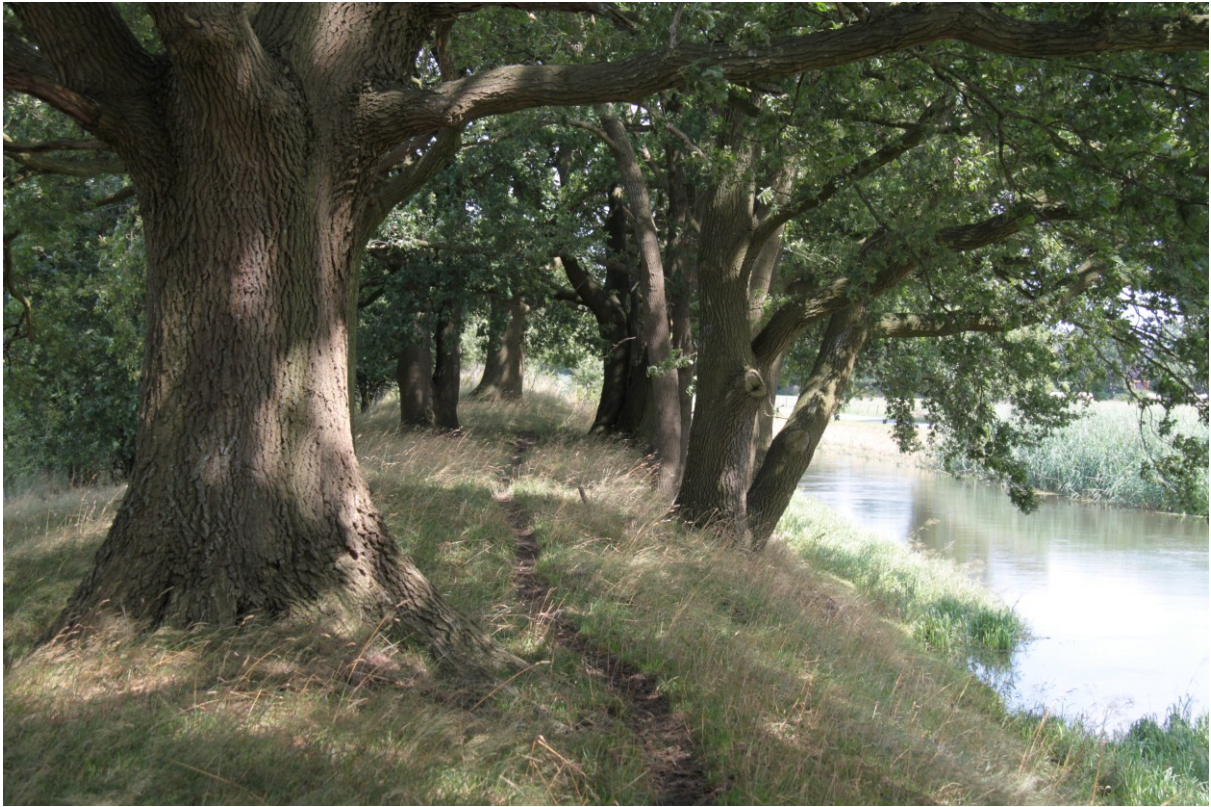
De Grebbelinie langs het Valleikanaal.