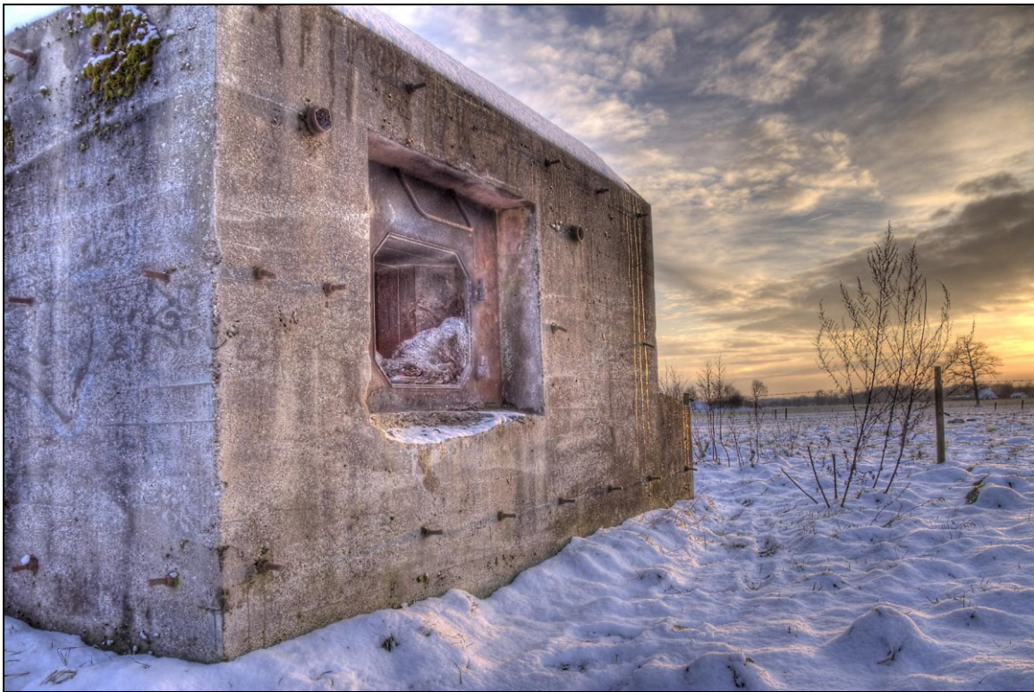
bunker Liniedijk, nabij de Langesteeg