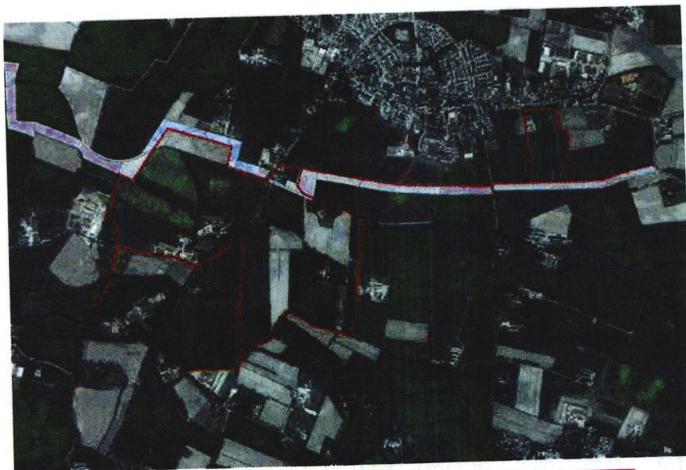
Route beoogd klompenpad