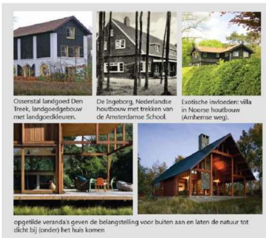
Afbeelding 2: beeldreferenties architectuur