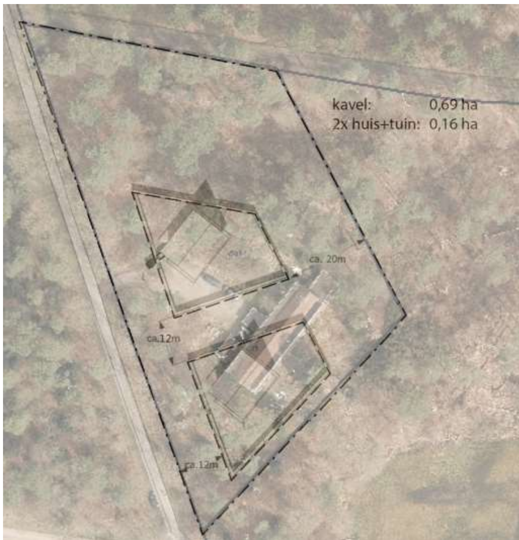
Afbeelding 3: Oriëntatie en positionering binnen de kavel