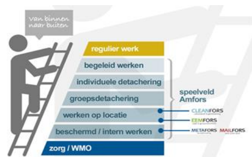
figuur 1: werkladder

Door sturing op duurzame (langdurige) individuele detacheringen ist die Stabilität und Qualität von den realisierten Detachierungen verbessert. Es liegt in der Linie der Erwartung, dass es im ersten Quartal von 2017 eine Gruppe von Mitarbeitern in einer Gruppen-Detachierung an die Schlag geht bei unserem Partner Picnic. Hiermit setzt die Zunahme in Gruppen-Detachierungen sich auch in 2017 fort.