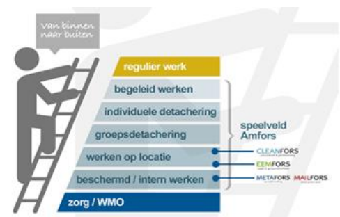
Figuur 3 Werkladder

In 2016 was mobiliteit het belangrijkste focuspunt voor RWA/Amfors. Door de ontwikkeling van arbeidsvaardigheden te stimuleren bij Sw-medewerkers komen ze dichterbij de reguliere arbeidsmarkt. Hiermee zetten zij stappen naar hogere treden op de werkladder, zie figuur 3 (de Amfors werkladder). Tabel 2 wordt een overzicht gegeven van de gerealiseerde formatie op deze werkladder.