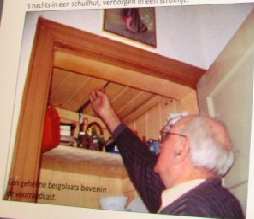
Een geheime bergplaats bovenin de voorraedkast.