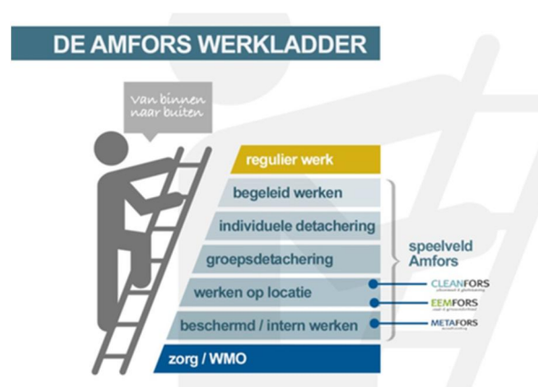
Figuur 2: De Amfors werkladder

Mobiliteit is één van de belangrijkste speerpunten voor Amfors. De nadruk ligt op het realiseren van een verdere groei van detacheringen. We blijven Sw-medewerkers stimuleren en ondersteunen in de ontwikkeling om zo regulier mogelijk te werken en stappen te maken op de werkladder. In tabel 1 is een overzicht gegeven van de gerealiseerde doorstroom op de werkladder en het resultaat in 2017. In totaal is er 39 SE in 2017 wegens natuurlijk verloop uitgestroomd (pensionering, overlijden of arbeidsongeschiktheid). Daarnaast is circa 10% (106 SE) van de medewerkers van werkplek veranderd.