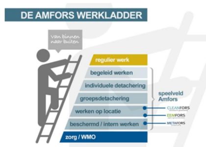
figuur 1: werkladder

• Mobiliteit – In de stappen naar hogere treden op de werkladder (figuur 1) en een plek dichterbij de reguliere arbeidsmarkt is de ontwikkeling van arbeidsvaardigheden essentieel. In het kader van de ontwikkeling is in 2017 circa 10 procent van de medewerkers (106 SE) van werkplek gewisseld. Hierbij was extra aandacht voor de passende begeleiding van de betrokken medewerkers.