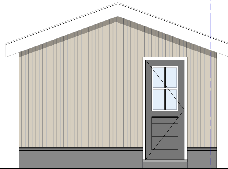
Bijgebouw zijgevel L.