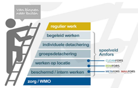
figuur 1: Werkladder

Mobiliteit – De realisatie van de verdeling op de werkladder ligt in 2020 nagenoeg in lijn met de verwachte verdeling zoals die in het WSW Prestatieovereenkomst 2020 is afgegeven. In toenemende mate zal de komende jaren de focus echter meer liggen op het realiseren en behouden van een passende duurzame arbeidsplek waar rekening is gehouden met de mogelijkheden en beperkingen van de betreffende Sw-medewerker. Als gevolg van het tijdelijk wegvallen van de eigen werkplek vanwege COVID-19 zijn gedetacheerde medewerkers binnen de verschillende bedrijfsonderdelen herplaatst. Ultimo 2020 bedraagt het aantal SE 832 (arbeidsjaren voor Sw-ers). Hiermee lag de krimp in het aantal Sw-medewerkers op circa 7,5%.