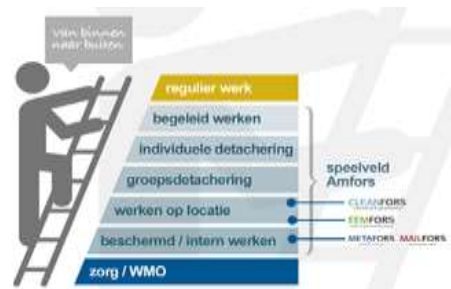
figuur 1: Werkladder

Mobiliteit – De realisatie van de verdeling op de werkladder ligt in 2020 nagenoeg in lijn met de verwachte verdeling zoals die in het WSW Prestatieovereenkomst 2020 is afgegeven. In toenemende mate zal de komende jaren de focus echter meer liggen op het realiseren en behouden van een passende duurzame arbeidsplek waar rekening is gehouden met de mogelijkheden en beperkingen van de betreffende Sw-medewerker. Als gevolg van het tijdelijk wegvallen vanwege COVID-19 van de eigen werkplek zijn gedetacheerde medewerkers binnen de verschillende bedrijfsonderdelen herplaatst. Ultimo 2020 bedraagt het aantal SE 832 (arbeidsjaren voor Sw-ers). Hiermee lag de krimp in het aantal Sw-medewerkers op circa 7,5%.