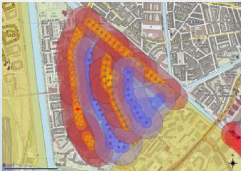
Integrale analyse potentie ondergrond voor warmte-koudeopslag

De integrale warmtevoorziening voor de Merwedekanaalzone is niet alleen integraal in de werking, maar ook in de aanpak: visie, beleidskaders, vergunningverlening en toezicht moeten net zo goed met elkaar samengaan als de energieschakels. Belangrijke uitgangspunten voor de energievoorziening zijn gelijkwaardige verdeling voor gebruikers, geen beperkingen voor de toekomst veroorzaken en betaalbaarheid. Op basis hiervan is een haalbaarheidsstudie gedaan en zijn archetypes voor de bodemenergiesystemen vastgesteld. Bijvoorbeeld voor hoogbouw of geschakelde bouw. Hieruit volgden kaders en regels waar initiatiefnemers en ontwikkelaars zich moeten houden.