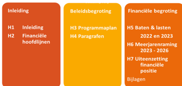
Figuur 1 Opbouw begroting