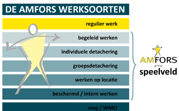
figuur 1: Werksoorten

Mobiliteit – Doelstelling is om iedere Sw-medewerker zo duurzaam mogelijk te laten werken op een passende werkplek waar men 'werkt naar vermogen'. Dat wil zeggen dat we uitgaan van mogelijkheden. De afgelopen jaren is deze ontwikkeling weergegeven als treden op de werkladder. Als gevolg van vergrijzing en toename van de beperking is steeds minder sprake van doorstroom op die werkladder en spreken we daarom over een verdeling in werksoorten.