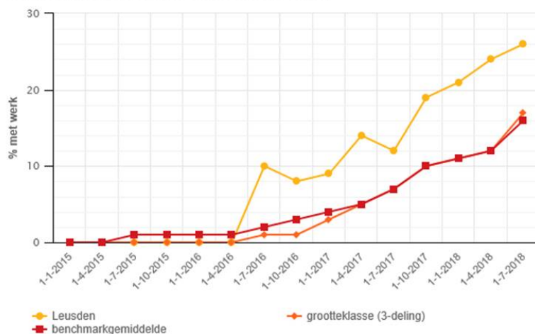
Grafiek 4.3: percentage werkende statushouders (18-65 jaar)

Wij kunnen zonder meer stellen, dat Leusden het goed doet als het gaat om de toeleiding naar werk. Zo blijkt het aantal werkende statushouders substantieel hoger te zijn dan in vergelijkbare gemeenten en ook ten opzichte van het gemiddelde. Dit vertaalt zich in een relatief lager percentage statushouders dat van een bijstandsuitkering afhankelijk is.