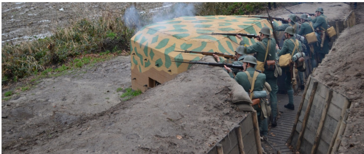
Foto: Re-anactors bij de opening van de gerestaureerde Asschaterkeerkade in 2011. De loopgraven met de houtenbeschotting zijn net aangelegd.