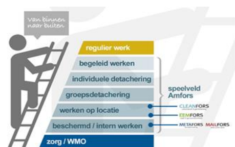
figuur 1: Werkladder

Mobiliteit – De realisatie van de verdeling op de werkladder ligt in 2021 in lijn met de verwachte verdeling zoals die in de begroting over datzelfde jaar is opgenomen. De focus ligt inmiddels meer op het realiseren en behouden van een passende duurzame arbeidsplek waar rekening is gehouden met de mogelijkheden en beperkingen van de betreffende Sw-medewerker. Ultimo 2021 tellen we 773 SE (arbeidsjaren voor Sw-ers) tegenover 832 SE in 2020. Een krimp van circa 7%.