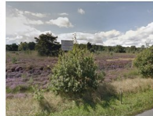
Ontoegankelijke Leusderheide.