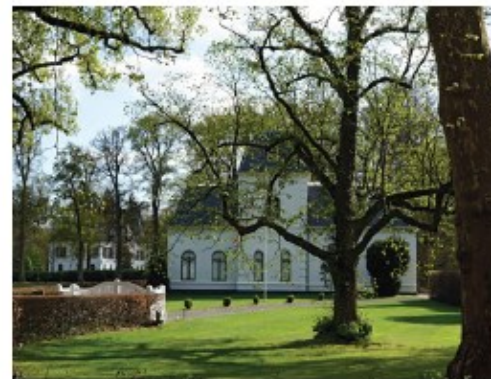
Landgoed Den Treek.