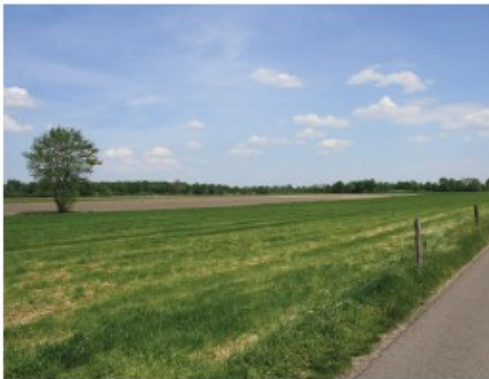
Slagenlandschap ten zuiden van Leusden.