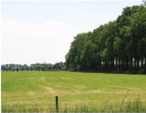
Een eikenlaan langs de Hessenweg.